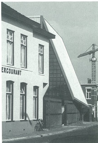
Nieuwe vorm in oud stadsbeeld